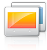
Персонализиране на дисплея: