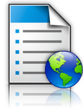
Формуляри и често използвани материали

Възможностите за решения на серията се съчетават с инструментите за управление на флотилията от устройства на Lexmark и съществуващите ви корпоративен софтуер и техническа инфраструктура, за да формират екосистемата на интелигентните многофункционални устройства на Lexmark. Нейната адаптируемост пригажда за бъдещето вашите инвестиции в технологии на Lexmark.